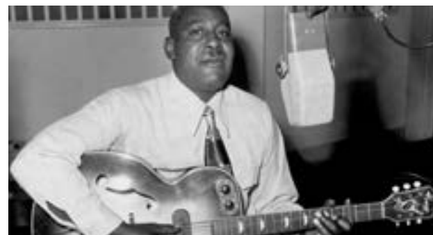
▲ Původní píseň That's All Right, Mama napsal bluesman Arthur „Big Boye“ Crudup v roce 1946.

► That's All Right vypustila do rozhlasového éteru memphiská stanice WHBQ Radio, když ji do svého pořadu Red, Hot and Blue zařadil diskžokej Dewey Phillips.