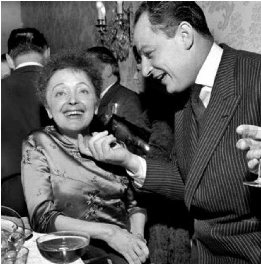
hudba a text: Charles Dumont & Michel Vaucaire zpívá: Édith Piaf