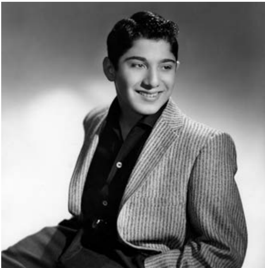
hudba a text: Paul Anka zpívá: Paul Anka