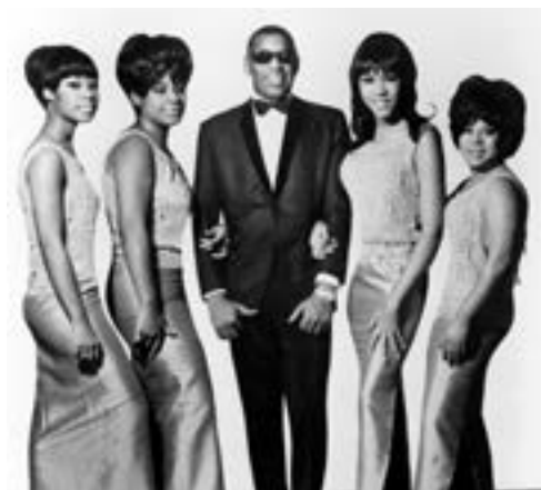
▲ Vokalistky, které si říkaly The Raelettes, opakovaly v této písni všechno, co zpíval Ray Charles.

odmítla hrát s odůvodněním, že je příliš sexuálně provokativní. Jak napsal časopis Billboard: „Je to dialog mezi zpěvákem a doprovodnými vokalistkami, který sice začíná v kostele, ale končí v posteli.“ Oč byla nahrávka kritizovanější, o to byla mladými lidmi kupovanější – během několika týdnů to dotáhla na šestou příčku americké hitparády a stejný časopis ji tentokrát označil za „nejsilnější popovou skladbu, jakou do té doby jakýkoli umělec napsal“. A bez nadsázky ji lze označit i za jednu z nevlivnějších písní – právě po jejím poslechu se Paul McCartney rozhodl založit kapelu, The Beatles ji pak za svého hamburského období hráli každý večer. Stejně tak když Mick Jagger poprvé zpíval s kapelou, ze které se později stali The Rolling Stones, nasadil What'd I Say. Že měla největší vliv na jejich tvorbu, říkají i Eric Burdon z kapely Animals, Brian Wilson z Beach Boys či Van Morrison. Mimochodem, společně se skladbou Be-Bop-a-Lula od Genea Vincenta je jmenována i v hitu Walk of Life od skupiny Dire Straits jako příklad nestárnoucích fláků. Ostatně Gene Vincent ji měl rovněž v repertoáru – stejně jako Brenda Lee, Eric Clapton, Nancy Sinatra, Johnny Cash, Jerry Lee Lewis, jenž s ní v roce 1961 vystoupal na třicátou příčku americké hitparády, nebo Elvis Presley, který s ní o tři roky později vyšplhal na jedena-dvacáté místo a zpíval ji i ve slavném filmu Viva Las Vegas.