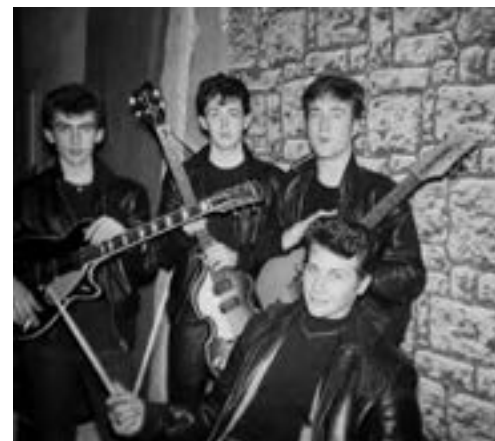
▲ Právě po poslechu What'd I Say se Paul McCartney rozhodl založit kapelu The Beatles.