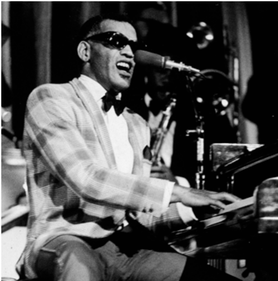
hudba a text: Ray Charles zpívá: Ray Charles

Přebral už úplně všechny písně – k dovršení smlouvaného koncertního času však ještě dvanáct minut scházelo. Obrátil se na kapelu: „Sledujte mě a dělejte, co řeknu!“ A začal improvizovat. Tak trochu ve stylu boogie-woogie, které následně přešlo do gospelu – a jeho vokalistky, které si říkaly The Raelettes, opakovaly vše, co zpíval Ray Charles. „Nebylo to nic jiného, než co jsme znali z kostela,“ řekl později slavný zpěvák.